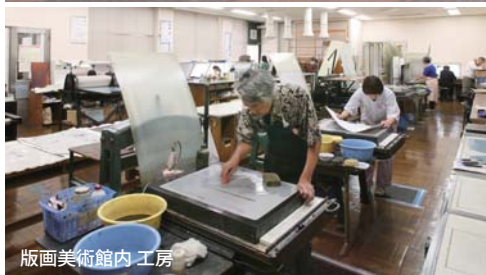
版画美術館内 工房