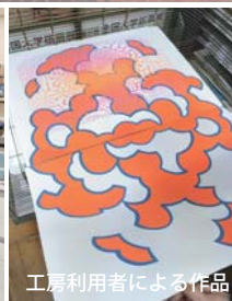
工房利用者による作品